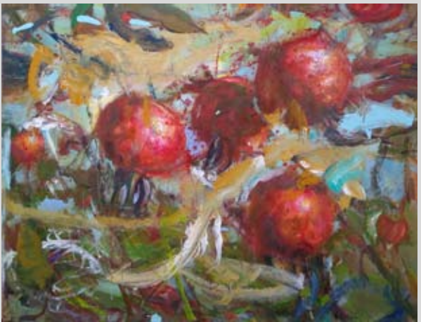
Rafał Pacześniak, Krzew 1