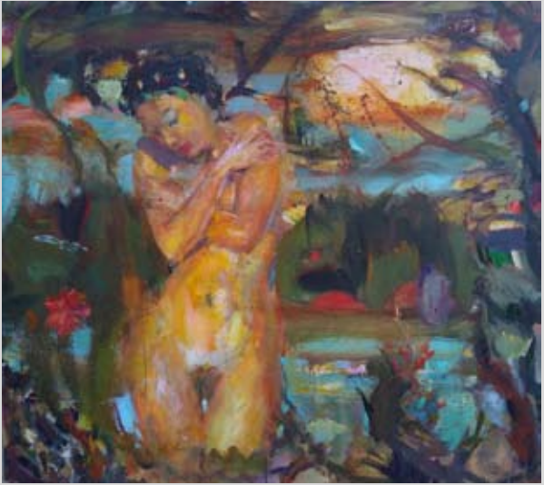
Rafał Pacześniak, W oddaleniu