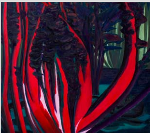
Grzegorz Wnęk, Ogród tajemniczych istot III